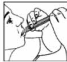
Llevar a la boca presionar y extraer

Si los síntomas empeoran o persisten después de 7 días debe consultar a su médico.